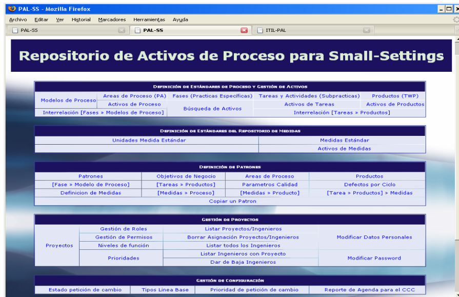
Figura 4. Menú principal de la biblioteca de activos.

La Figura 4 muestra la pantalla principal del repositorio de activos que se ha definido; en ella se aprecian cuatro partes bien diferenciadas: definición de estándares de proceso y gestión de activos, definición del repositorio de medición, definición de patrones y gestión de proyectos. Si se añaden nuevos procesos al repositorio, puede ser necesario añadir nuevos conceptos al repositorio; así, por ejemplo, en el caso del proceso de gestión de configuración, se añade, entre otros, el concepto de línea base.