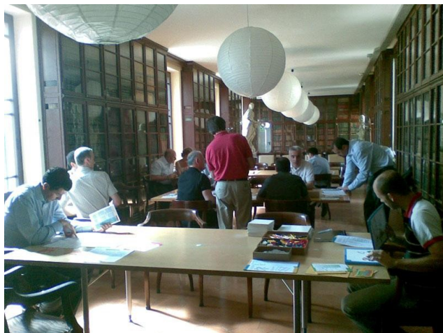
Una instantània de l'acte

Aquesta simulació fou dissenyada per a posar de manifest