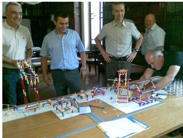
Un moment de la simulació

Un testimoni de com va anar la sessió, el podeu trobar en el bloc Gobierno de las TIC de l'Antonio Valle, soci de l'ATI: http://www.gobiernotic.es/2008/07/jugando-con-los-proyectos.html