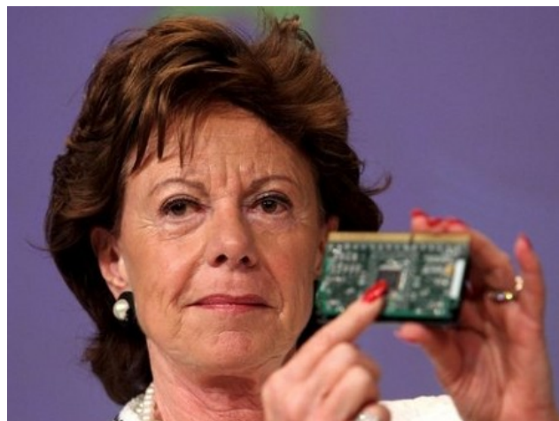
Neeli Kroes, Comissària de competència de la Comissió Europea, mostrant un xip d'Intel

Segons ha dictaminat la Comissió Europea, Intel va pressionar a diversos fabricants d'ordinadors i a importants