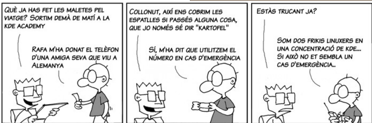
Tira Ecol gentilesa de Javier Malonda i SomGNU. Podeu seguir l'original en castellà o la traducció al català

La vostra publicitat a l'abast de més de 2.000 professionals de les noves tecnologies, tècnics i directius d'empresa en aquest butlletí.