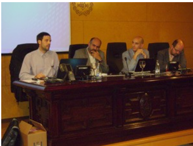
Els ponents en un moment de la xerrada

Productivity Advisor, del CIP, qui va fer una descripció general dels aparells mòbils actuals (escenaris de treball, millors pràctiques, plataformes, riscos, fluxos de feina, etc), tot fent un repàs a la història dels primers que van aparèixer, remontant-se, fins i tot, als aparells que s'utilitzaven al camp de batalla de la primera guerra mundial.