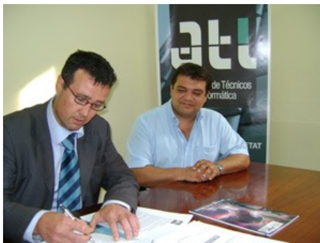
Moment de la signatura de la col·laboració