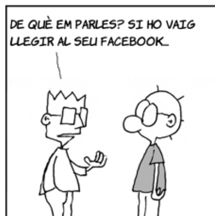
[English Version] http://en.tiraecol.net

Tira Ecol gentilesa de Javier Malonda i SomGNU. Podeu seguir l'original en castellà o la traducció al català