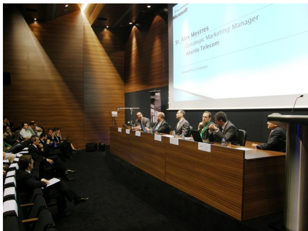
Un moment de l'acte