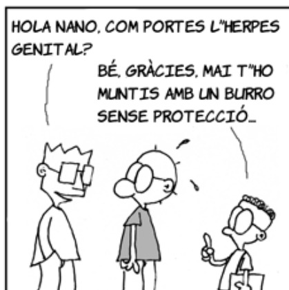
TIRA ECOL (CC some rights reserved) - Javier Malonda

La vostra publicitat a l'abast de més de 2.000 professionals de les noves tecnologies, tècnics i directius d'empresa en aquest butlletí.