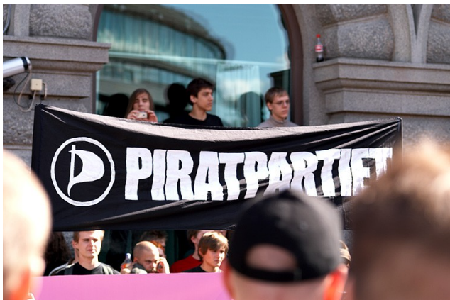
Una manifestació del Partit Pirata a Estocolm el 3 de juny de 2006

Tal i com ja havíem avançat amb anterioritat en aquesta mateixa publicació, el Partit Pirata suec* s'ha fet amb un escó en el Parlament Europeu gràcies als excel·lents resultats obtinguts en les eleccions d'aquest diumenge dia 7, en les que fins a 19 països triaven els seus representants a la cambra del vell continent.