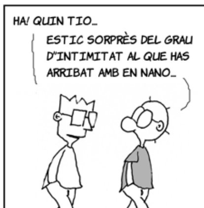
[Versión Original] http://www.tiraecol.net