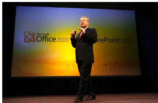
Un moment de la presentació del nou Office

Microsoft ha anunciat la disponibilitat a nivell mundial de la nova versió de la seva suite ofimàtica Office, la 2010, i de SharePoint 2010, Visio 2010 i Project 2010 per a usuaris corporatius. L'enfocament d'aquesta nova versió de les eines ofimàtiques de la companyia de Redmond es centra més encara en la col·laboració i el treball compartit.