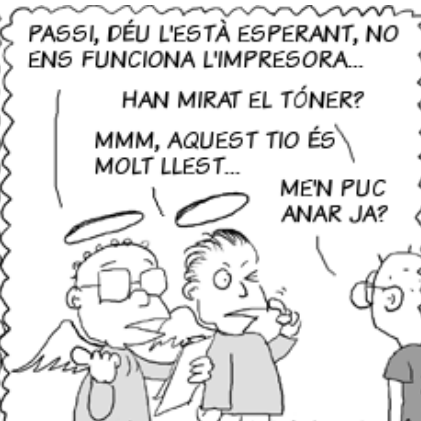
(english version): comic.escomposlinux.org