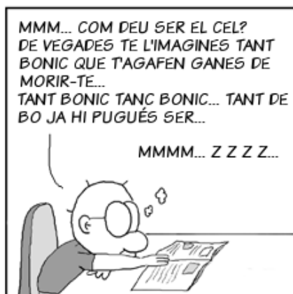
COPYRIGHT (c) TIRA ECOL - Javier Malonda

La vostra publicitat a l'abast de més de 2.000 professionals de les noves tecnologies, tècnics i directius d'empresa en aquest butlletí.