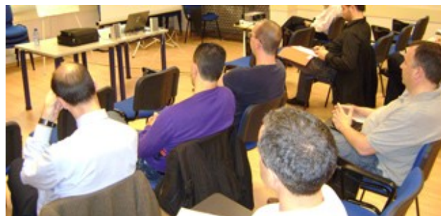
Un moment de la xerrada