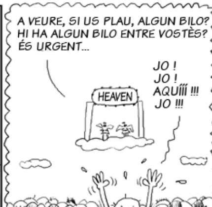
(versión española): tira.escomposlinux.org