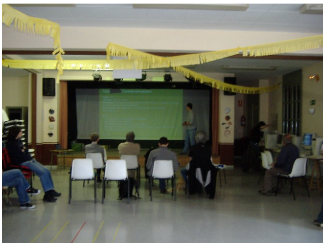
Un moment d'una de les xerrades que vaig impartir a Vallfogona.

conferències dedicades a l'apartat tecnològic, mentre que la nit del divendres i la del mateix dissabte restaven reservades per a la vessant més lúdica amb actuacions de disc-jockeys.