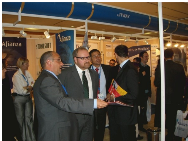
Un moment durant la inauguració de l'edició del Fòrum corresponent a l'any passat

ATI col·labora en aquesta cinquena edició del Fòrum @asLAN Expo Barcelona. Gràcies a aquesta col·laboració els seus socis poden beneficiar-se d'un 50% de descompte a la inscripció. Així, heu de fer clic aquí *