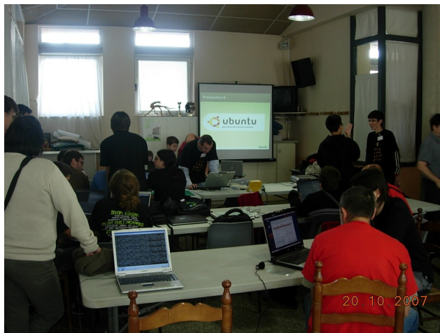
Una de les conferències que es van donar durant l'edició de l'any passat de la party

Entre les activitats de les que podrem gaudir a la trobada hi trobem concursos com el de DDR, llançament de rata (llençar tan lluny com sigui possible un ratolí d'ordinador a imatge i semblança dels concursos de llançament de mòbil que s'organitzen al nord d'Europa), Frets on Fire (un clònic del Guitar Hero en programari lliure disponible per a les tres grans plataformes informàtiques: Windows, Mac OS X i GNU/Linux), i de Modding .