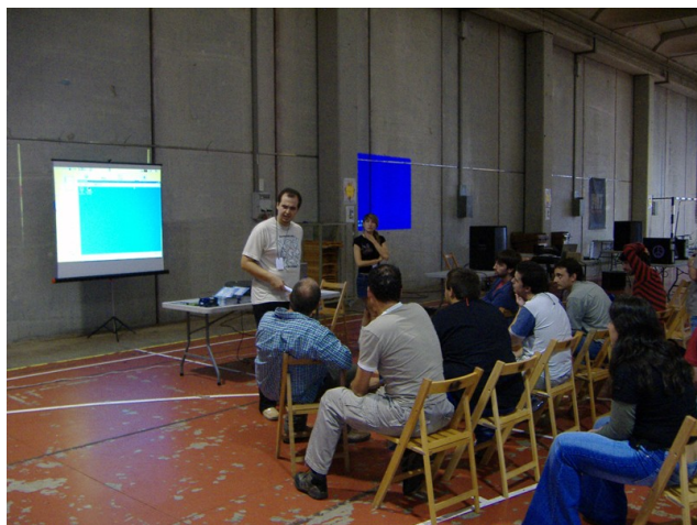
Una imatge d'una de les xerrades que es va donar a la primera edició de la Volcànica, al setembre del 2006

Del 19 al 21 de Setembre al Centre Cívic de les Preses es realitza una nova edició de la Volcànica.cat , la tercera consecutiva enguany que consolida la cita i en fa una de les de referència en el sector. L'organitza conjuntament el Servei de Noves Tecnologies del Consell Comarcal de la Garrotxa i l'Associació d'Ordinadors Enllaçats amb col·laboracions. L' Associació de Tècnics d'Informàtica - ATI , amb d'altres administracions, empreses i entitats, també hi dona suport.