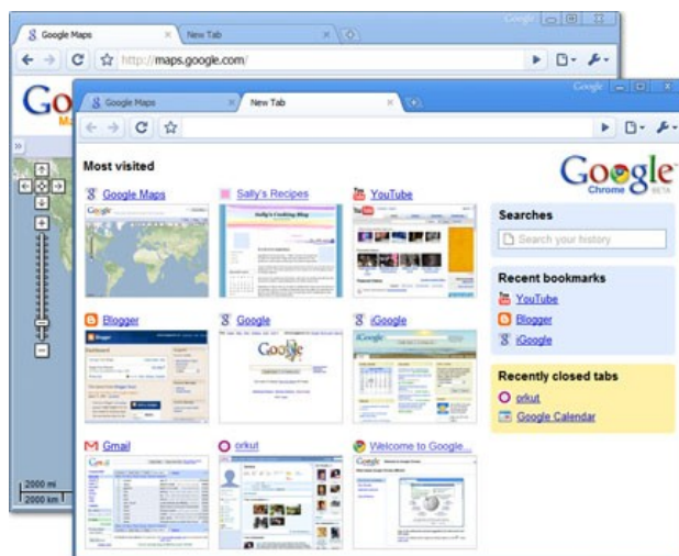
Una captura de pantalla del nou Google Chrome

El navegador web Firefox semblava ser fins ara el preferit de la companyia, ja que venia inclòs en el seu conjunt d'aplicacions Google Pack. Chrome ha estat desenvolupat no d'acord amb aquest ni amb altres navegadors, sinó des de zero partint de la proposta de com hauria de ser un navegador web òptim per als treballadors de la companyia i els usuaris dels seus serveis i productes.