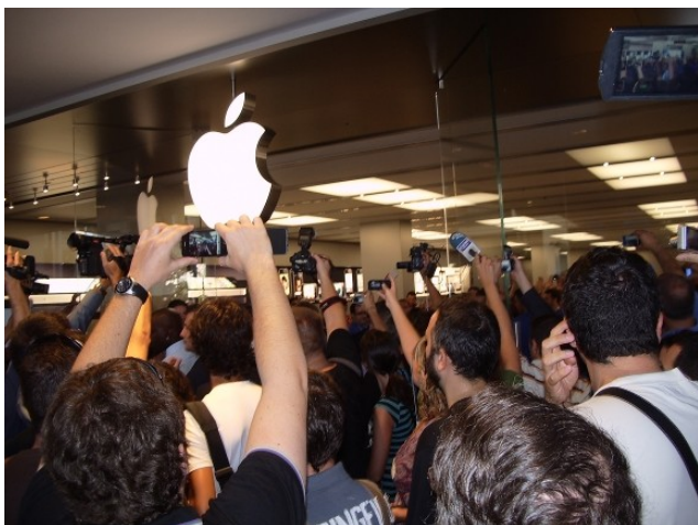
La premsa esperava expectant el moment en què els primers clients van trepitjar la botiga.

comprar els productes sorgits de les ments pensants de Cupertino a través de la botiga en línia del mateix fabricant, bé a través de botigues al detall o grans cadenes d'electrònica que els venien, especialment els reproductors de música i, en menor mesura, els ordinadors.